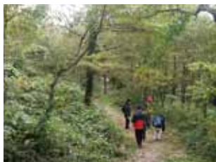
「森の案内人と歩く森のおさんぽ」では、ハンモックのある秘密の森カフェにご案内します。

10月12日(日)、国立山口徳地青少年自然の家を会場に「森カフェ～森林セラピーフェスティバル～」を開催します。この日は予約なしで森林セラピーの各種プログラムが楽しめるほか、カワラケツメイ茶やハンモックのある「秘密の森カフェ」がオープンします。お気軽にご参加ください。詳細は森林セラピー山口HPをご覧ください。